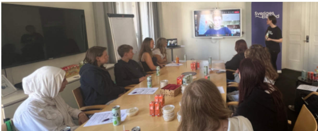
Bild från BOOST i Malmö.