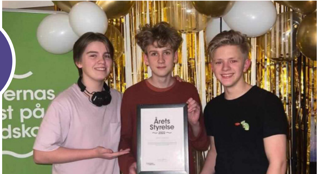
Bild från kvällens elevrådsgala där bland annat pris för "Årets Styrelse" delades ut till UMK:s Elevkår från Uppsala.